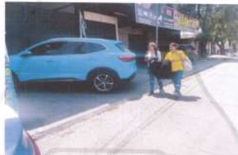
Transeúntes que tuvieron que caminar sobre la carretera, ya que su vehículo obstruyó la banqueta

TERCERO. – en fecha 05 de abril del 2023 se solicitó mediante oficio, al área de c4 las videograbaciones de las cámaras ubicadas en LIBRAMIENTO NORTE ENTRE ESQUINA AVENIDA DE LA LUZ, COLONIA RICARDO FLORES MAGON, MUNICIPIO DE TEPOTZOTLÁN, ESTADO DE MÉXICO en caso de ser afirmativo, favor de proporcionar